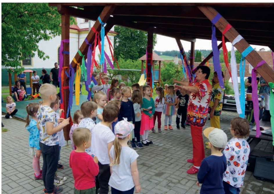
Pasování na školáky