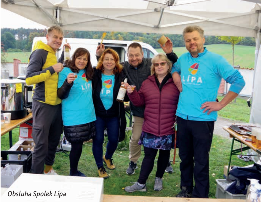
Obsluha Spolek Lípa