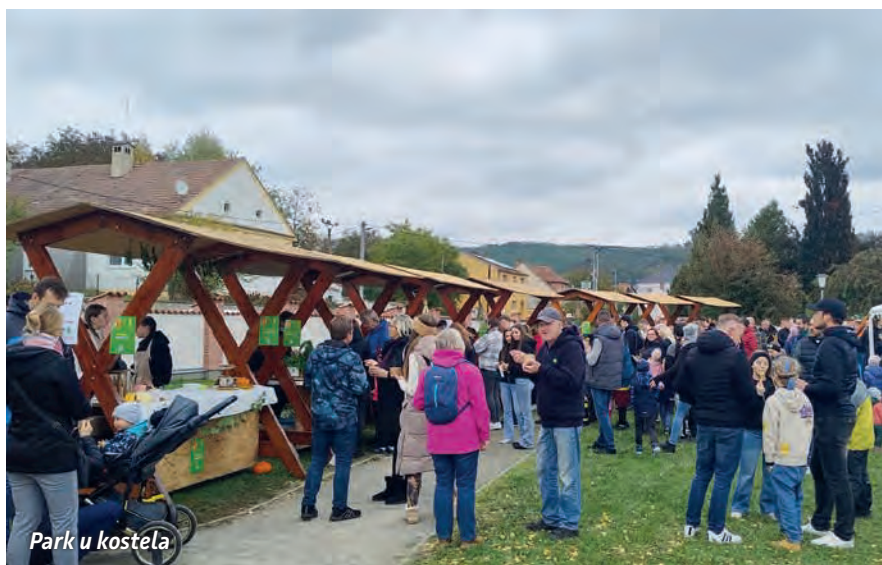
Park u kostela