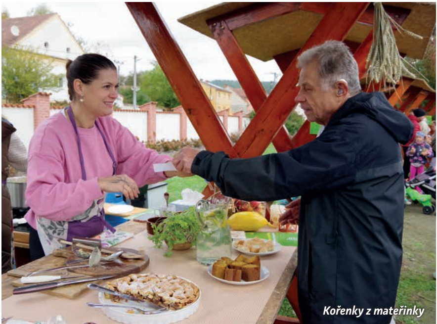
Kořenky z mateřinky