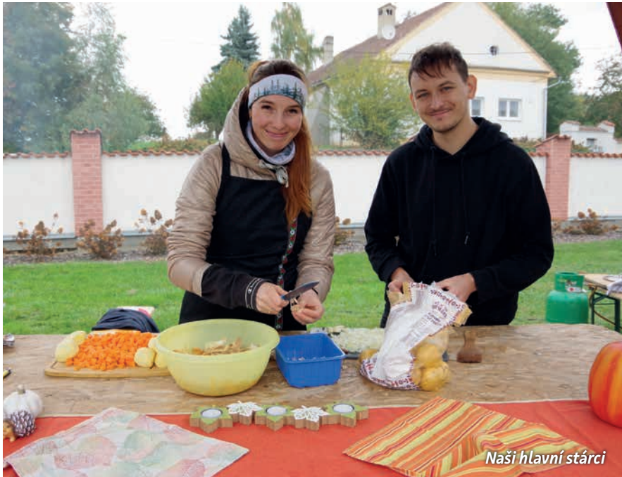
Naši hlavní stárci