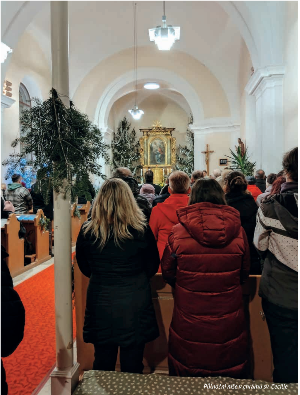
Půlnoční mše v chrámu sv. Cecílie