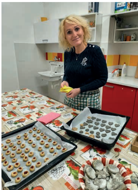
Vánoční jarmark v ZŠ

Děkujeme všem sponzorům ať z řad občanů, firem, obce Lipůvka i okolních obcí a kraje za finanční, materiální i morální podporu akce. V letošním roce jsme vystupovali kromě domácí Lipůvky v Brně Řečkovících, Bořitově, Hodoníně a Rájci Jestřebí. Stavili jsme se také na Mikulášskou nadílku dětem z dětského domova ve Vranově.