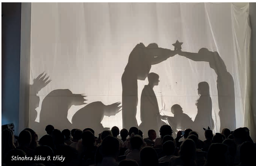
Stínohra žáku 9. třídy

Úsilí spojené s přípravami na vystoupení jednotlivých tříd i školního sboru se zúročilo během téměř dvouhodinového programu, který letos dosáhl vysoké úrovně a hlavně vysokého ocenění, potlesku i slz dojetí od publika.