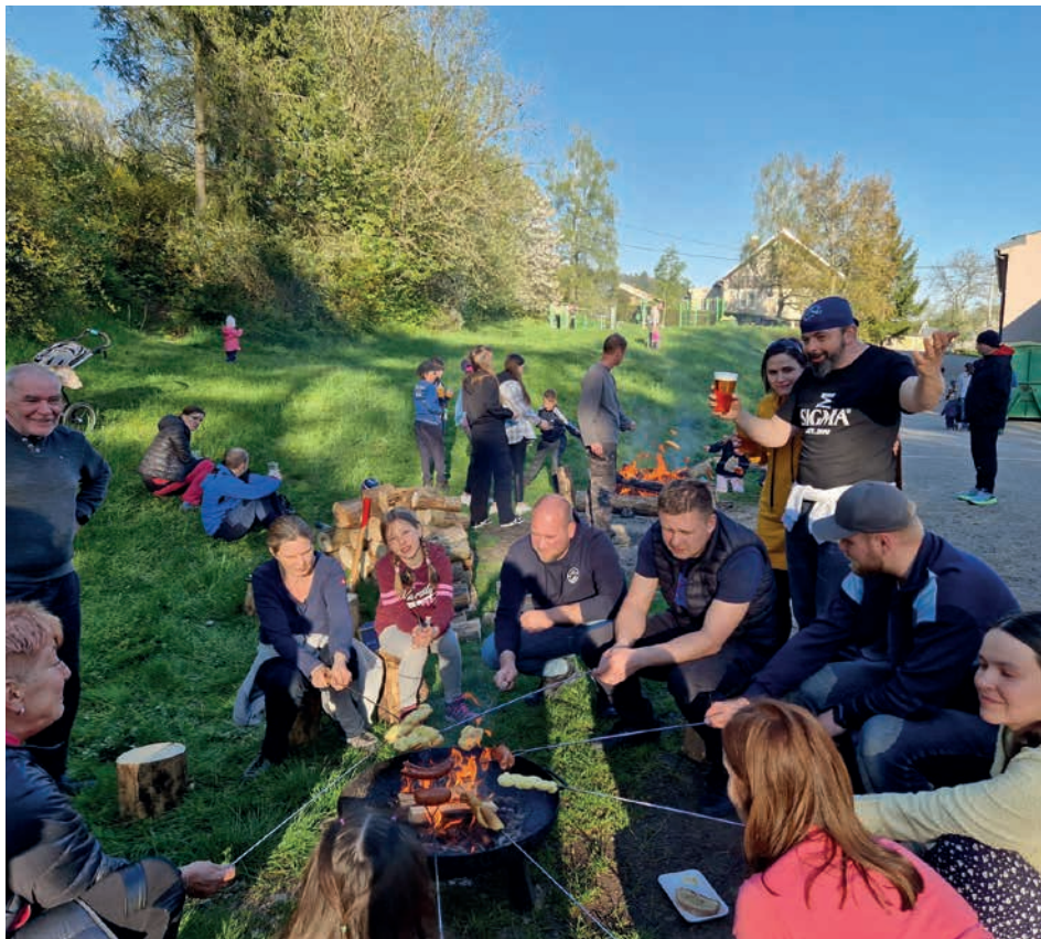
Čarodějnice za školou