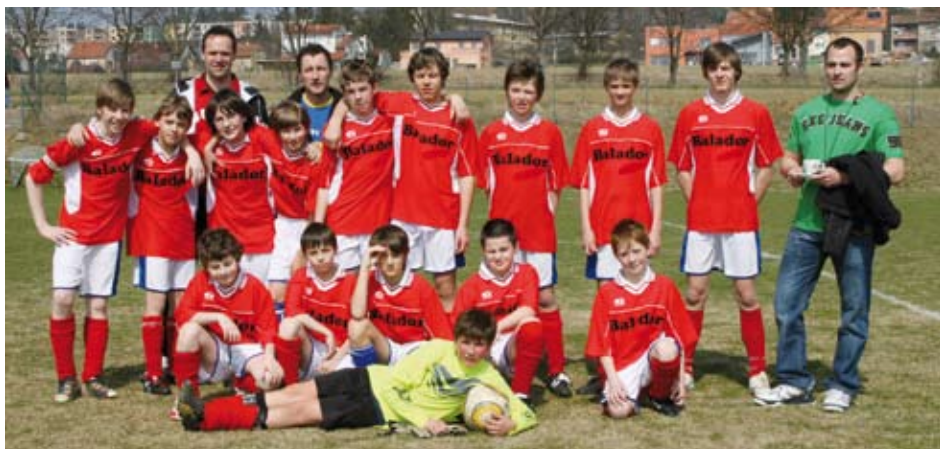
Žáci ASK Lipůvka