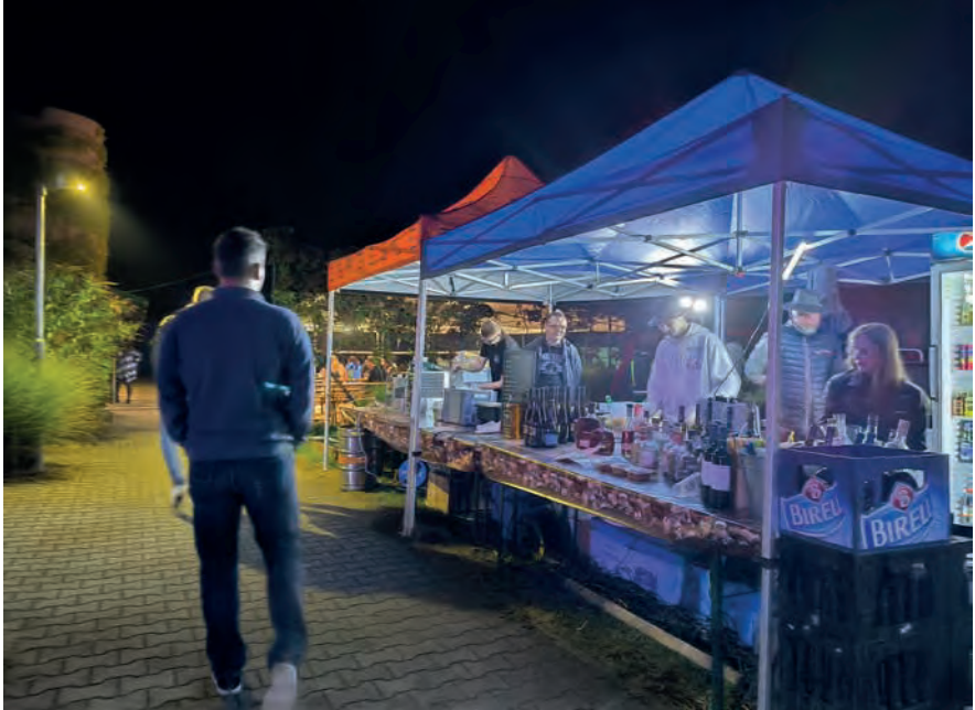
Lipůvská letní noc