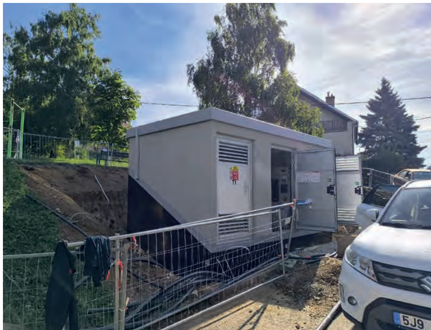
Nový rozvaděč pro školu a blízké okolí