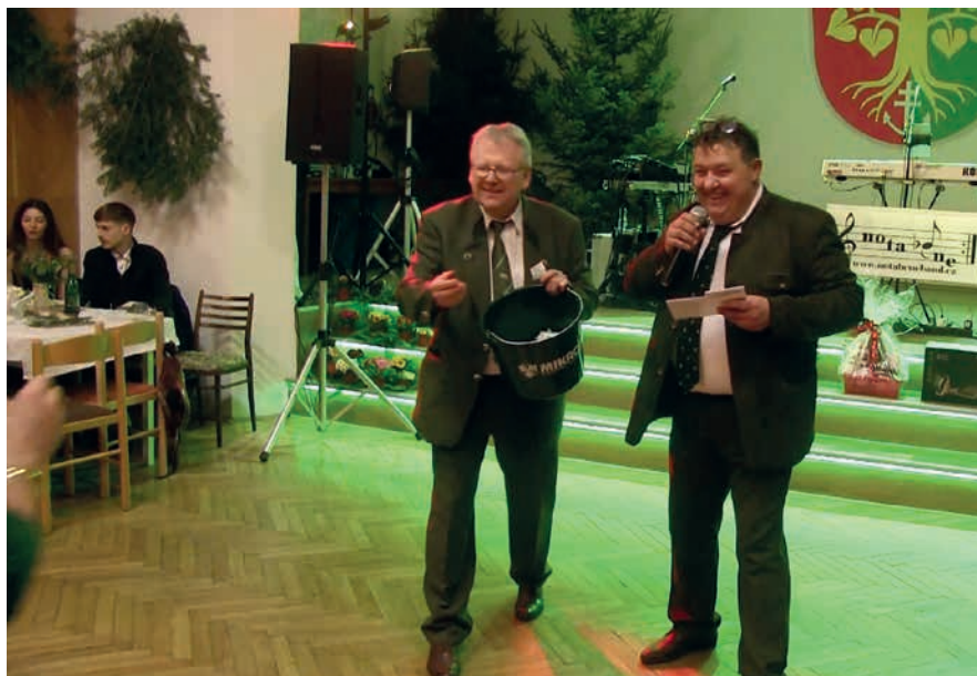
Myslivecký ples na Lipůvce