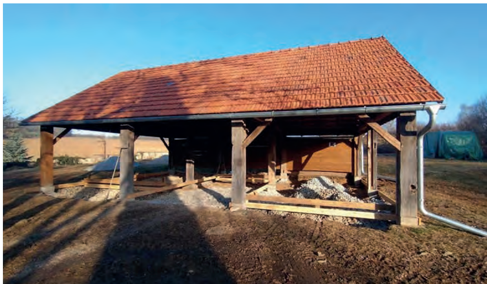
Brigáda na Farní stodole