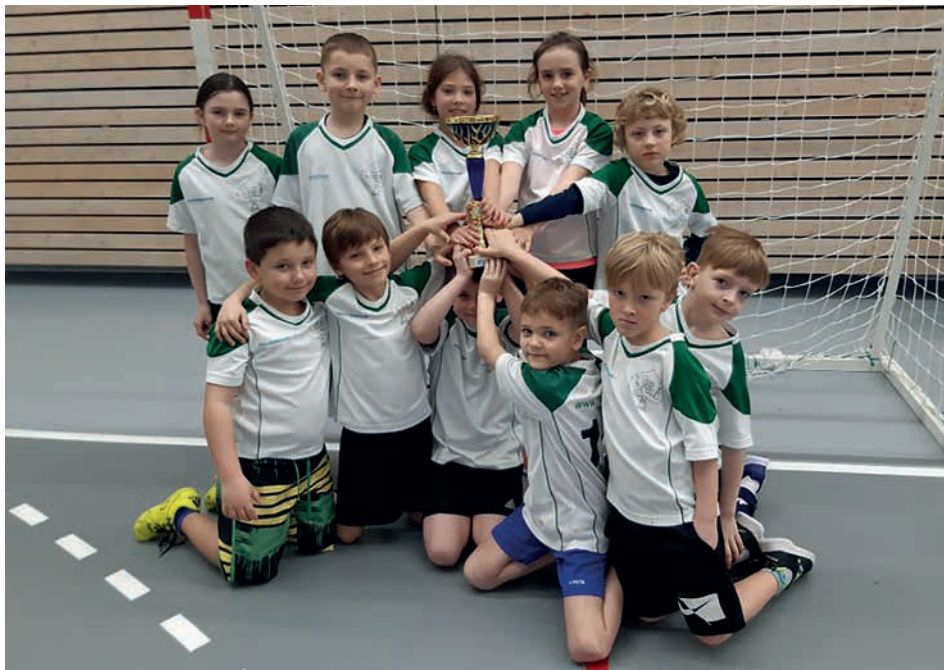
Turnaj v házené v Kuřimi, naši žáci 2. místo