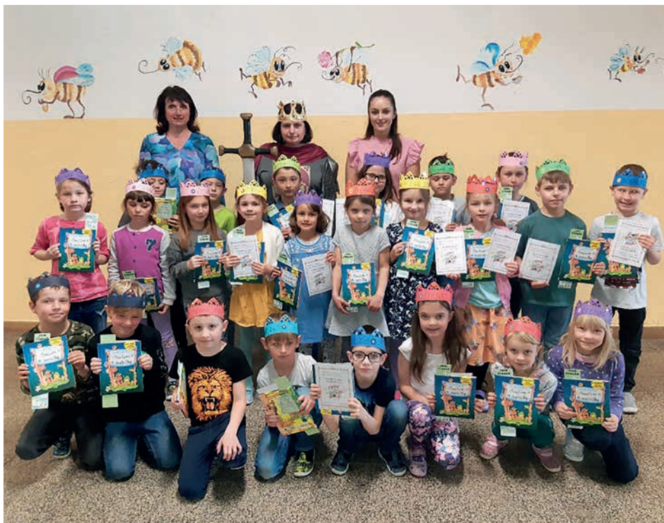
Pasování prvňáčků na čtenáře

Z 30 žáků 9. třídy bylo přijato do učebních oborů 8 žáků, 21 žáků je přijato do maturitních oborů středních škol. Jedna žákyně je v současné době nepřijatá. Kam se děti dostaly vidíte v tabulce na následující straně.