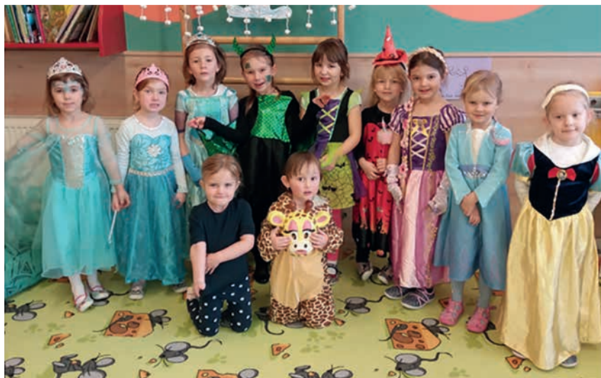
Karneval v MŠ